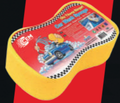
OTO YIKAMA SÜNGERİ