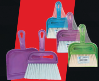
ARAÇ İÇİ MİNİ FIRÇA SETİ