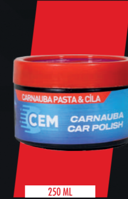
STOK KODU: CEM-PASTA1-250ML

Keep away from children. Avoid contact with skin and eyes. To protect the skin, avoid prolonged contact with hands. Do not use it to clean hands, face, body and food items. In case of contact, wash with plenty of water. If accidentally swallowed, consult a doctor immediately.