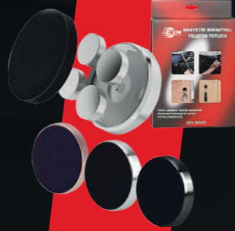
MANYETİK MİKNATISLI TELEFON TUTUCU