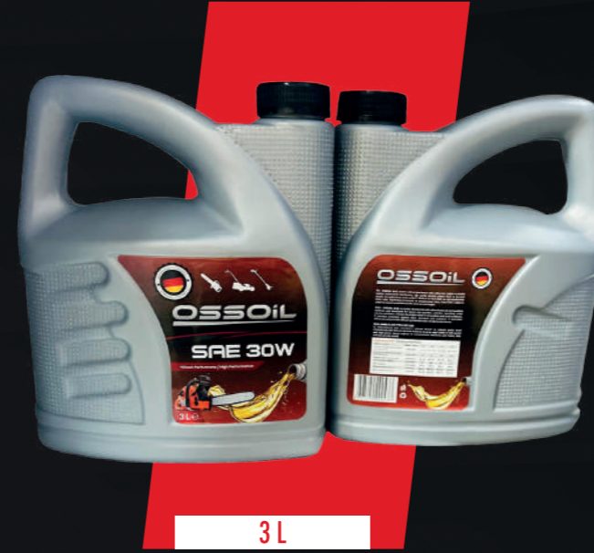
STOK KODU: OSSOIL-30W-3LT

Oss oil 2T should be mixed with 2% unleaded petrol. It is recommended for use in high power and high speed engines.