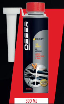
STOK KODU: OSS-01022

Before using the product, change the engine oil and filter, shake the can for better mixing and add the engine oil while it is hot. It is suitable for use with gasoline and diesel engine oils, but it is not recommended as it is not necessary to add it as an additive to synthetic engine oils. For vehicles with a capacity between 4 liters and 8 liters, 1 box is sufficient. Keep away from children. Avoid contact with skin and eyes. Do not use it to clean hands, face, body and food items. In case of contact, wash with plenty of water. If accidentally swallowed, consult a doctor immediately.