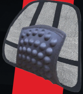
BEL DESTEĞİ (MASAJLI)