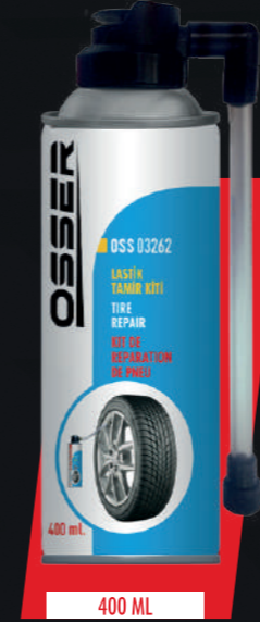
STOK KODU: OSSER-SP-006

Keep away from children. Avoid contact with skin and eyes. In case of contact, wash with plenty of water. If accidentally swallowed, consult a doctor immediately.