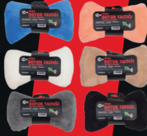
ARAÇ BOYUN YASTIĞI