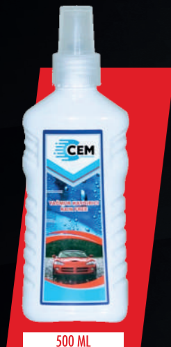
STOK KODU: OSSER-SP-007