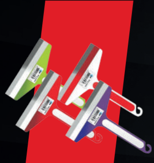
12 CM MİNİ CAMSİL