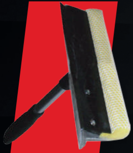
100 ML METAL SAPLI CAM ÇEKÇEK SÜNGERİ