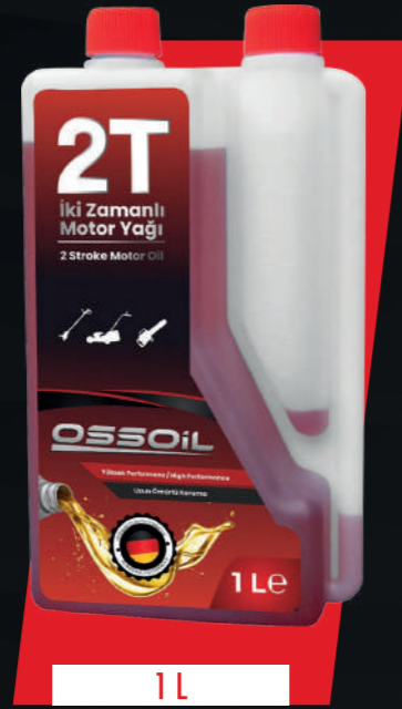
STOK KODU: OSSOIL-2T-1LT