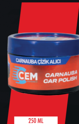
STOK KODU: CEM-PASTA2-250ML

Keep away from children. Avoid contact with skin and eyes. To protect the skin, avoid prolonged contact with hands. Do not use it to clean hands, face, body and food items. In case of contact, wash with plenty of water. If accidentally swallowed, consult a doctor immediately.