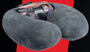
SEYAHAT BOYUN YASTIĞI