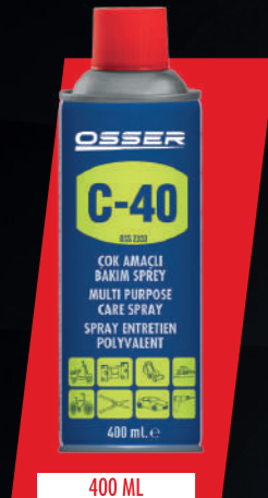
STOK KODU: C-40

Temizler, yağlar, korur, kalıntıları ve yapışkanları çözerek aşırı zor lekeleri gevşetir. Pastan dolayı sıkışan parçaları çözer. Paslı yüzeylere derinlemesine nüfuz ederek gevşemelerini sağlar ve tutunur. En dar ve sıkışık yerlere nüfuz ederek yüzeyi dış etmenlere karşı korur. Su ve nemi uzaklaştırır, otomotiv ve gemi sanayinde, elektrik kontaklarında, motorlarda suyun ve nemin istenmediği yerlerde mükemmel bir su itici olarak kullanılır. Korozyona karşı korur. Sinir bozucu gıcırtı seslerini ortadan kaldırarak uzun bir süre sessiz çalışmalarını sağlar. Kullanmadan önce çalkalayınız. Özel valf sistemi sayesinde kutu baş aşağı şekilde de kullanılabilir. Kutunun yanında bulunan kırmızı çubuğu spreyn üzerinde bulunan aktuatöre takarak sıkılacak yüzeye uygulayınız, nüfuz etmesini bekleyiniz. Çevreye zarar vermeyen, ozonla dost itici gaz içerir. Basınçlı kap; kullanımdan sonra dahi delmeyiniz veya yakmayınız. Isıdan, kıvılcımdan, alevden, sıcak yüzeylerden uzak tutunuz. Güneş ışığından koruyunuz. 50 C /122 F aşan sıcaklığa maruz bırakmayınız. Çocuklardan uzak tutunuz. Cilt ve göz ile temasından kaçınınız. El, yüz, vücut ve gıda maddelerinin temizliğinde kullanmayınız. Temas halinde bol su ile yıkayınız. Yanlışlıkla yutulması halinde derhal doktora başvurunuz.