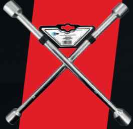
4'LÜ BİJON ANAHTARI NİKELAJLI