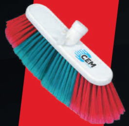
OTO YIKAMA PARÇASI