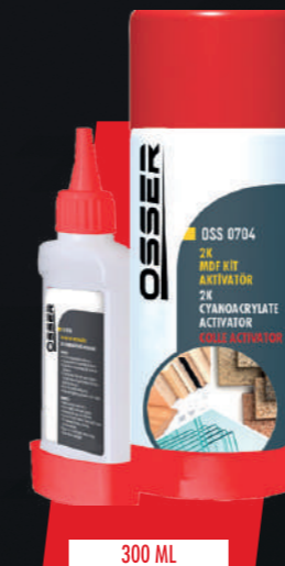
STOK KODU: OSS-0704

Before using the product, change the engine oil and filter, shake the can for better mixing and add the engine oil while it is hot. It is suitable for use with gasoline and diesel engine oils, but it is not recommended as it is not necessary to add it as an additive to synthetic engine oils. For vehicles with a capacity between 4 liters and 8 liters, 1 box is sufficient. Keep away from children. Avoid contact with skin and eyes. Do not use it to clean hands, face, body and food items. In case of contact, wash with plenty of water. If accidentally swallowed, consult a doctor immediately.