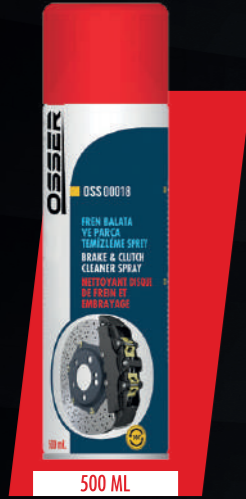
STOK KODU: OSSER-SP-007