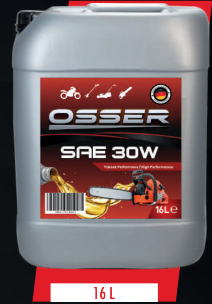
STOK KODU: OSSOIL-30W-16LT